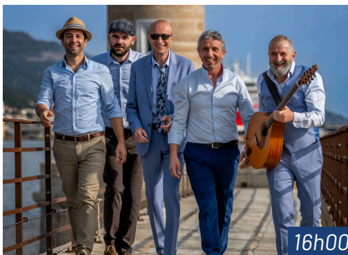
EPPO Musique corse