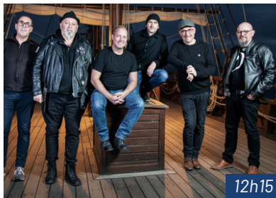
CAPSTERN Chants de marins