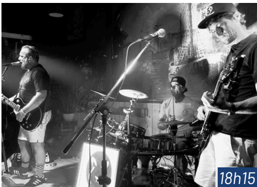
PANDA BAND Rock & pop-rock