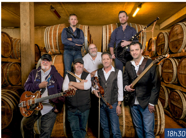
FEST NOZ SONERIEN DU