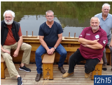
LES SOUILLÉS DE FOND DE CALE Chants de marins