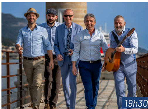
EPP0 Musique corse