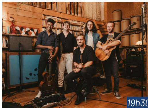
SAVINA SOCIAL CLUB Folk-rock